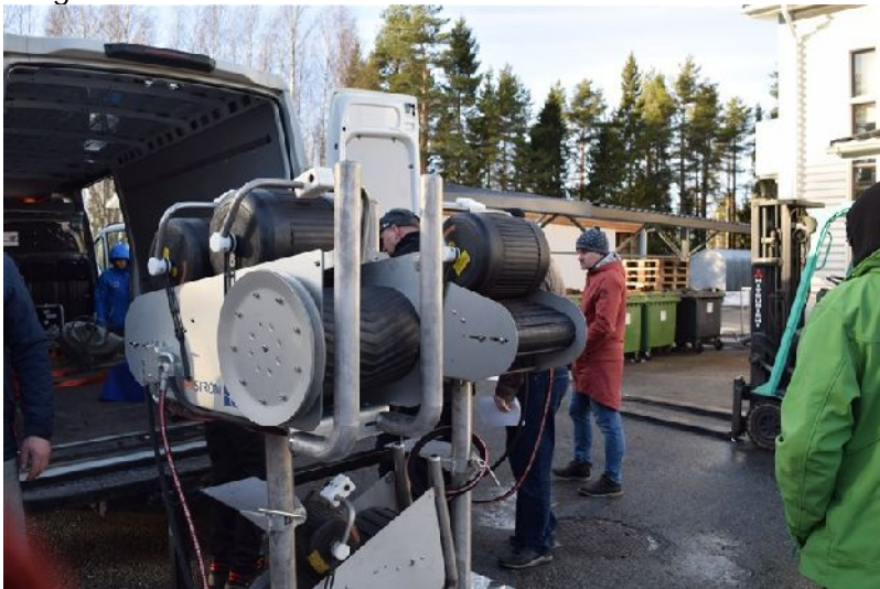
Võrgumasinade erinevad mudelid

Ettevõtte pakub erinevaid abiseadmeid suuremahuliseks kalapüügiks, toodetakse võrgumasinaid, räimepumpasid, jääpuure ja jääsaagisid. Ettevõtte eripäraks on see, et kliendile pakutakse täislahendusi, võrgumasinad on koos kaasaskantavate hüdropumpadega, seega sobivad need ka alustele kus statsionaarset hüdroüsteemi ei ole.