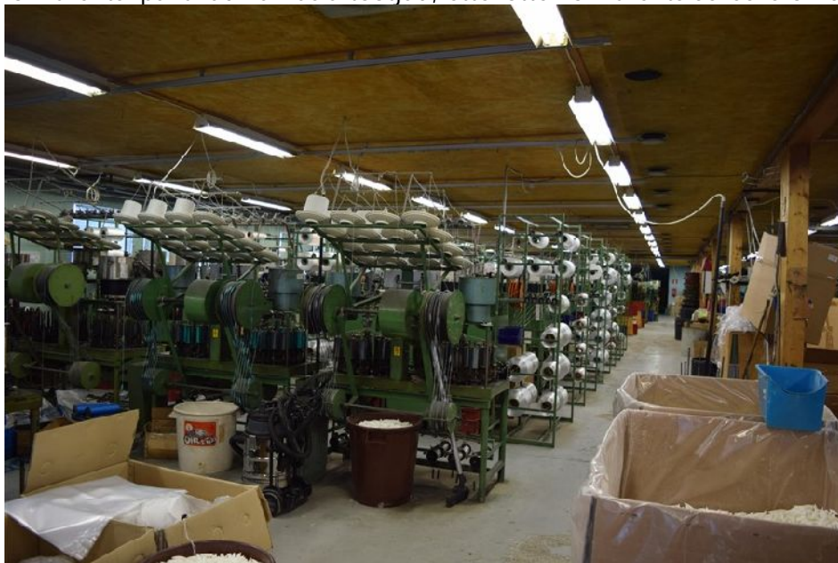
Björkö Telnfabrik Ab OY tootmine

Ettevõtte põhitegevus on erinevate nõõride, kõite ja võrkude tootmine. Ettevõtte on väga pikkade tootmistraditsioonidega ning tegutseb alates aastast 1956, tootmises keskendutakse eelkõige kvaliteedile. Lisaks tootmisele vahendatakse erinevaid kalapüügiks ja merenduseks vajaminevaid kaupu nagu mereriided, jääkastid, võrgumaterjalid jms. Ettevõtte asutamisel oli põhiturg Soome, Rootsi ja Norra, tänaseks päevaks on Skandinaaviamaade osakaal klientuuri hulgas märkimisväärselt vähenenud ning asemele on tulnud kesk Euroopa kliendid, teravat konkurentsi pakuvad ka Aasia tootjad, ettevõtte konkurentsieliseks on eelkõige kvaliteet.