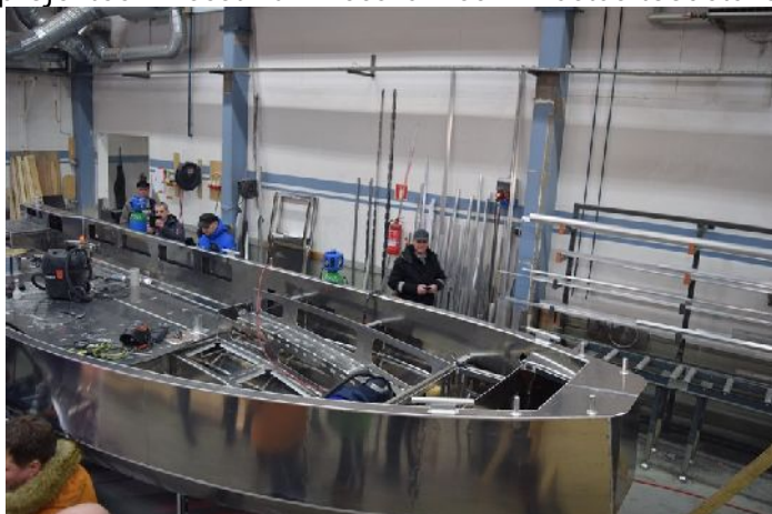
PG Made OY Ab tootmine

Ettevõtte toodab erinevaid alumiiniumist ujuvahendeid, peamiselt on spetsialiseeritud tööaluste tootmisele, sealhulgas ka väikesed kalapüügi alused maksimaalse pikkusega 10 meetrit, toodetud on ka väikepraame ja muid merelisi erilahendusi. Aluse tootmine toimub tihedas koostöös kliendiga, ettevõtte pakub teenust nn võtmed kätte, alates aluse projekteerimisest kuni veeskamiseni. Aastas toodetakse ca 10 erinevat alust.